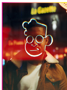
Juni Ba © DR

Placée sous la présidence de Philippe Besson, l'événement se déroulera les 5, 6 et 7 juin 2026 au Manège, situé rue du Pont Saint-Martial avec un décor inédit en centre-ville pour accueillir auteurs et leurs lecteurs, invitant chacun à ralentir pour explorer l'imaginaire, les récits et prendre le temps d'échanger avec les auteurs.