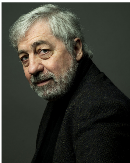
Sorj Chalandon 2473

Pour ce rendez-vous littéraire très attendu du public et des lecteurs, Lire à Limoges accueillera un invité de marque avec, comme Président, le journaliste et écrivain Sorj Chalandon. Son roman L'enragé , coup de cœur des libraires et classé parmi les meilleures ventes, vient d'être élu livre de l'année par le magazine littéraire Lire Magazine .