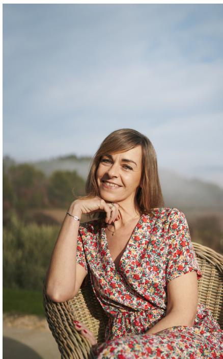
Agnès Martin-Lugand

Lire à Limoges accueillera la romancière Agnès Martin-Lugand, auteure de huit romans, tous salués par le public et la critique, en qualité de Présidente du Salon.