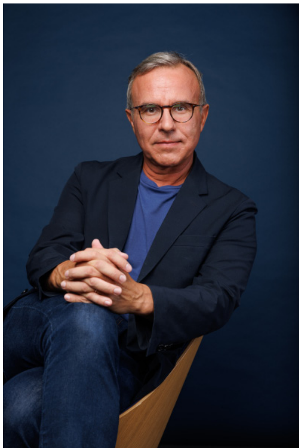
Philippe Besson

Pour l'édition 2026, qui se déroulera du 5 au 7 juin, le Salon littéraire Lire à Limoges a le plaisir d'annoncer la présidence de Philippe Besson.